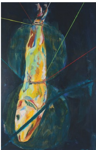
Robert Weissenbacher, Fischbild, 2013, auf Leinwand, 230 x 150 cm Robert Weissenbacher VG Bild-Kunst, Bonn 2015

Erstmals stellen in dem Gericht 13 Künstler ihre Kunstwerke aus. Bei der Vernissage besteht Gelegenheit zu direkten Gesprächen mit den Künstlern und dem Team der Galerie „Kunst/handeln“ ( www.kunsthandeln.de ).