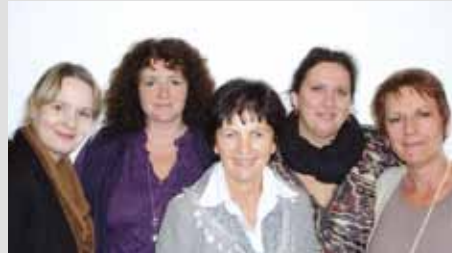
Die Sprecherinnen der LAG der Bayerischen Gleichstellungsstellen